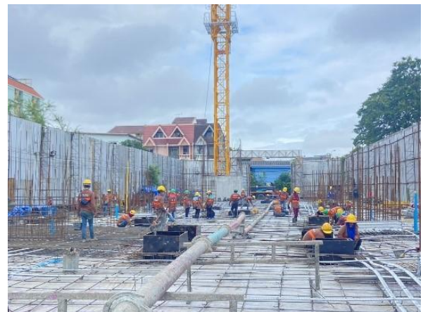
รูปที่ 1-1 สภาพภายในพื้นที่โครงการ